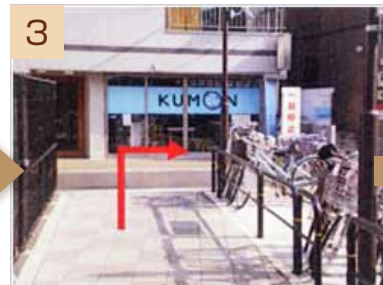
3 「KUMON」の前の路地を右へ曲がります。