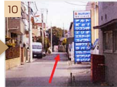
10 しばらく進むと、写真の看板が目に入ります。その隣が当施設となります。