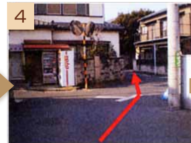
4 DyDoの自動販売機が見えたら、写真の矢印の道に進みます。