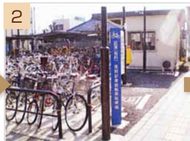
2 出口横にある駐輪場の脇を左に曲がります。