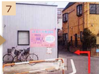
7 右折してすぐのところにある「はるかぜ整骨院」さんを左手に曲がり、道なりに進みます。