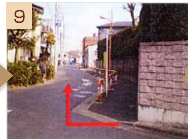
9 曲がってひとつ目の路地を右へ曲がってしばらく直進します(途中、左手に大きな煙突が見えます)。