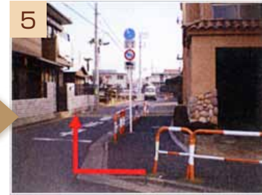
5 つきあたったら左折、茶色いマンションの角を右へ曲がってしばらく直進します(途中、右手に銭湯があります)。