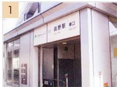
1 高野駅改札を出て左に進み、階段もしくはエレベーターを下ります。