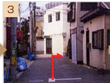
3 しばらく、道なりに進みます。(くねくねとした道になっています)