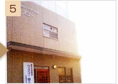
5 しばらく進むと、当施設になります。