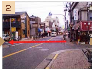
2 中華料理つくしさんが見えたら、道路を挟んだ向かいのパーキングの道に入ります。