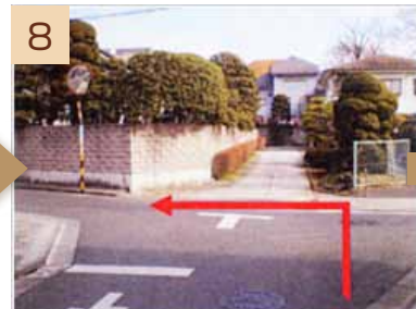
8 L字の路地を抜けてしばらく進んだところのつきあたりを左に曲がります。