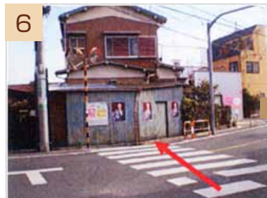
6 道なりに進むと国道にぶつかるので、横断歩道を渡り、右へ曲がります。