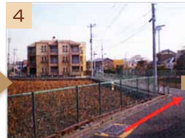
4 道なりに茶色のマンションに向かって進みます(途中、左手に蓮池があります)。