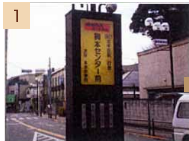
1 興本センター前のバス停から、西新井方面に向かって進みます。